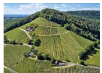
Waldläufer - Handthal

Schwierigkeit: leicht, 110 hm Strecke 9,3 km Dauer rund 2:15 h