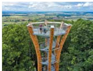
Burgherrenblick - Donnersdorf

Schwierigkeit: mittel, 140 hm Strecke 12,1 km Dauer rund 2:40 h