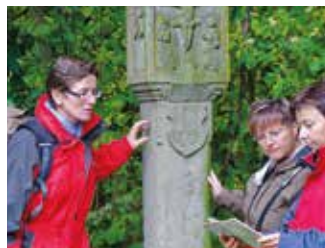
Rund um Obbach

Schwierigkeit: mittel / schwer, 270 hm Strecke 18,3 km Dauer rund 3:40 h