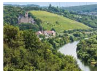
Höllental & Mainblick

Schwierigkeit: schwer, 300 hm Strecke 19,7 km Dauer rund 4:00 h