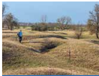
Gipsrundweg - Sulzheim

Schwierigkeit: leicht, 70 hm Strecke 11,5 km Dauer rund 2:30 h