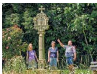
Steinhauerweg - Egenhausen

Schwierigkeit: mittel, 206 hm Strecke 12,0 km Dauer rund 3:10 h