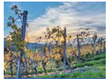
Dreiorama - Michelau

Schwierigkeit: sehr leicht, 30 hm Strecke 7,3 km Dauer rund 1:40 h