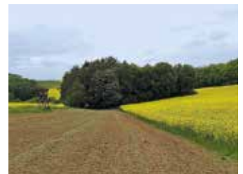
Lauerbachtal - Dittelbrunn

Schwierigkeit: leicht, 140 hm Strecke 13,2 km Dauer rund 3:00 h