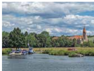
Fährenwanderweg - Wipfeld

Schwierigkeit: mittel, 160 hm Strecke 8,1 km Dauer rund 1:45 h