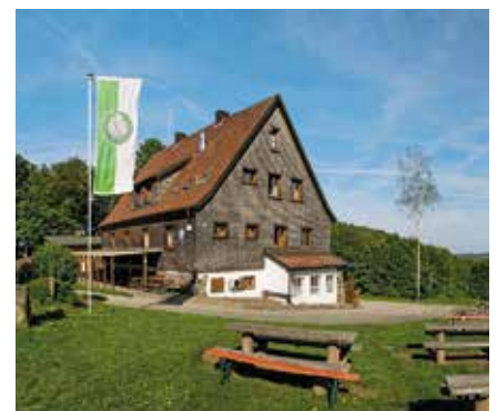
Würzburger Karl-Straub-Haus

Bei Schlechtwetter kürzere Wanderstrecke, ggf. Parkplatz Guckaspass oder in Oberweißenbrunn. Strecke jeweils 19 km hin und zurück bei jeweils 500 Höhenmetern.