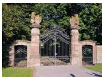
Geologieweg - Oberlauringen

Schwierigkeit: schwer, 380 hm Strecke 19,0 km Dauer rund 3:30 h