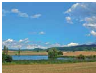
Ums Mahlholz - Gerolzhofen

Schwierigkeit: mittel, 210 hm Strecke 10,6 km Dauer rund 2:20 h