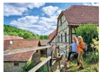
3-Tälerweg - Mainberg

Schwierigkeit: schwer, 70 hm Strecke 19,0 km Dauer rund 5:00 h